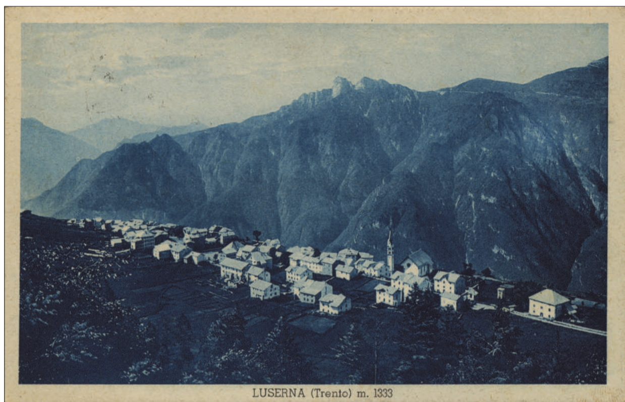
LUSERNA (Trento) m. 1333