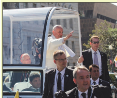
(prosegue da DSVL 21/07/17)